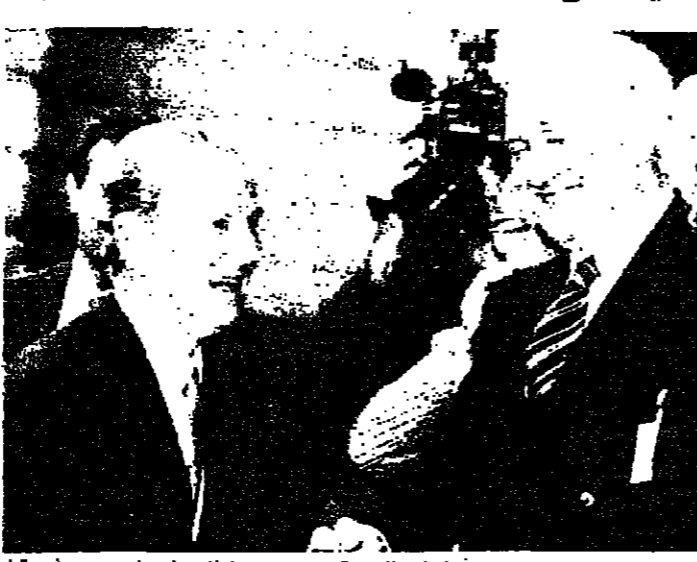
بيكر مصافحا شيفاردتارزه قبيل بدء المحادثات في برلين

تأمل القوى الكبرى في التوصل الى اتفاق يفسح الطريق امام الوحدة الالمانية وفي وقت لاحق من العام الحالي بالرغم من وجود خلافات حادة حول خطة سوفييتية لتقليد القوات المسلحة لدولة المانيا الموحدة. ورفض مسؤولون غربيون، خصوصا من بريطانيا وفرنسا، في برلين الشرقية، اسس الاول الخطة بوصفها محاولة من جانب الكومين. لاقناع المنتسدين داخل الاتحاد السوفياتي بتسكسه في موقف متشدد ازاء المسألة الالمانية. وتوقعوا ان تقبل موسكو حلا وسطا. وقال وزير الخارجية الفرنسي رولان دومان، ان هناك جوانب خارجية وداخلية للاقتراحات التي تقدم بها وزير الخارجية السوفياتي ادوارد شيفاردتارزه مشيرا الى ان الوزير السوفياتي ربما كان يفكر في الرأي العام داخل الاتحاد السوفياتي. وجاء مشروع شيفاردتارزه في نحو غير متوقع في محادثات الاثنين والاربعاء حول الوحدة الالمانية تضم وزراء خارجية دولتي المانيا وحلفاء الحرب العالمية الثانية. الولايات المتحدة والاتحاد السوفياتي وبريطانيا وفرنسا.